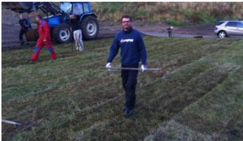
Mynd frá þökulagningu.

Enn meira þakkar KKA KEA fyrir sjálfan styrkinn sem KEA var búið að afhenda félaginu fyrir nokkru. Styrkurinn gerði félaginu kleift að þökuleggja gríðarstórt svæði, sem m.a. verður notað sem byrjendaæfingasvæði fyrir allra yngstu meðlimi félagsins. Peningar í grasrót íþróttastarfs margfaldast hjá félaginu rétt eins og fiskarnir forðum sem Jesús blessaði. Fyrir styrkfé KEA gat KKA þökulagt 2600 m 2 svæði.